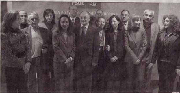
Imagen de grupo del candidato a la alcaldía y los 13 primeros de su lista, presentados ayer públicamente.