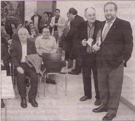
Orozco y Rodríguez antes de iniciar la conferencia.

FARO DE OURENSE Jueves, 8 de febrero de 2007