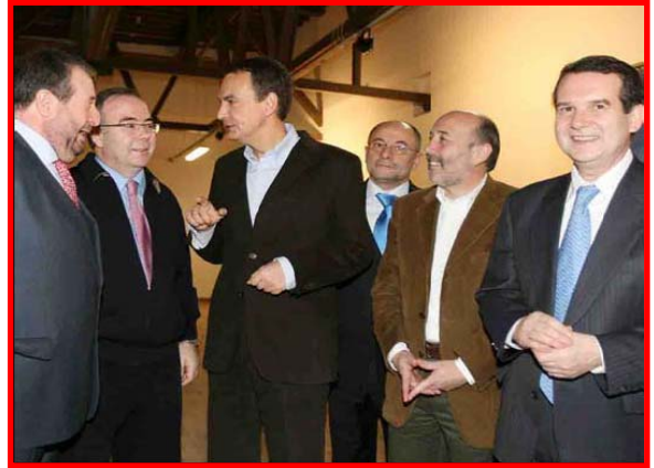
O candidato de Ourense e os candidatos socialistas das outras grandes cidades de Galicia xunto a Zapatero