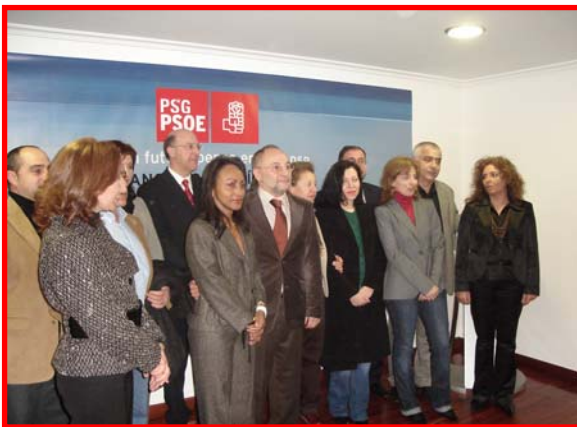
O candidato á Alcaldía xunto coas mulleres e homes da súa lista electoral