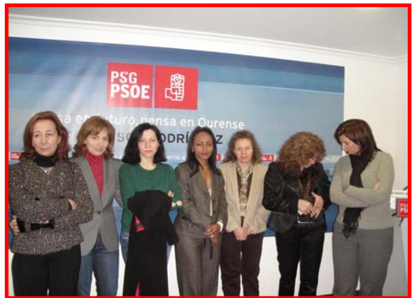
As catorce mulleres da lista socialista representan a aposta pola paridade e profesionalidade