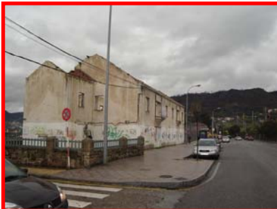
A primeira escola infantil da rede de garderías municipais será neste barrio

Os cativos ourensáns, o futuro da nosa cidade, precisan dos mellores coidados e instalacións para a súa socialización. Por iso, o candidato socialista á Alcaldía de Ourense aposta pola creación dunha rede municipal de garderías.