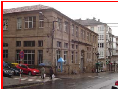
O centro neurálxico do barrio acollerá este proxecto

A Ponte convertiuse nos últimos anos nun importante núcleo urbán, e de xestión para os cidadáns do Distrito Norte. Son moitos os veciños que utilizan os servizos deste barrio. As ringleiras de coches en dobre fila, ou as dificultades para o aparcamento fan necesario pensar nun aparcadoiro, co obxectivo de desconxestionar a zona para unha mellor convivencia. O PSdeG-PSOE ten previsto construír neste barrio un aparcadoiro soterrado, debaixo da Praza de Abastos e nos aledaños das rúas do Mercado, Xeneral Aranda e Avda. das Caldas . Este aparcadoiro contará cunha superficie de 4.000 m2 en dúas prantas e acollerá un total de 200 prazas.