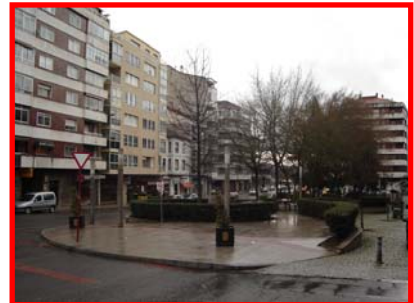
Un túnel liberará ó barrio de A Ponte do tráfico

Francisco Rodríguez pretende embelecer este barrio, que é a porta natural de entrada á cidade, construíndo un gran boulevard comercial na Av. de Santiago. Para iso, pretende desviar o tráfico a través dun túnel pola Av. de Santiago, a parte de arriba quedaría como un boulevard e zona comercial con soamente dous carrís de circulación para o casco urbán, irá acompañado de zonas verdes, paseos, con cafeterías, e zonas de espargimento . Esta importante obra precisará dunha gran dotación orzamentaria, da axuda do Ministerio de Fomento e a Consellería de Política Territorial, e de dúas lexislaturas para o seu desenvolvemento