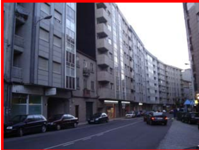
A Avenida de Portugal deixará de estar colapsada de tráfico