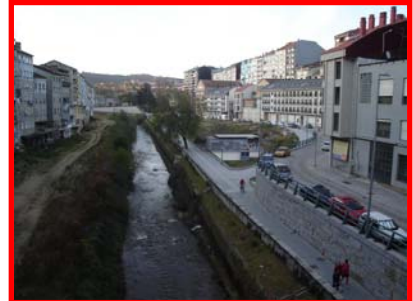
As ribeiras do Barbaña tinguirán de verde a cidade

Ribeiras verdes para o río Barbaña no seu paso polo barrio do Couto. Crearase unha banda verde con arboredas pegadas ó río, “con ribeiras non tan urbanas e cementadas, senón máis adaptadas ó que nos piden as normativas europeas, ou sexa, ribeiras adecuadas o seu estado orixinal” afirma o candidato socialista á Alcaldía de Ourense.