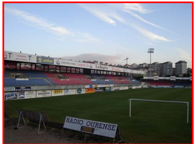
O obxectivo é crear en Ourense un contorno similar ó de Riazor