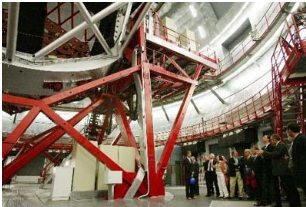
Inauguración de la instalación, el 13 de julio 2007

del presente año 2008. El lugar de instalación es de un cielo privilegiado por su calidad y por estar protegido por la Ley del Cielo 1 .